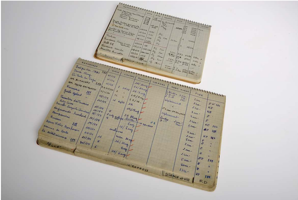
Carnets de commande, fonds Jean Lattes (40 F1).