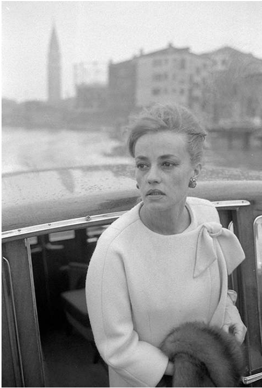
Jeanne Moreau, 1961.