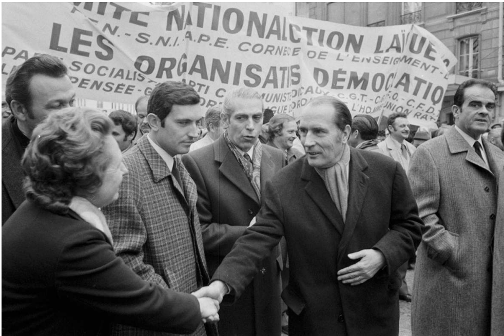
François Mitterrand, Comité National d'Action Laïque, 1972.