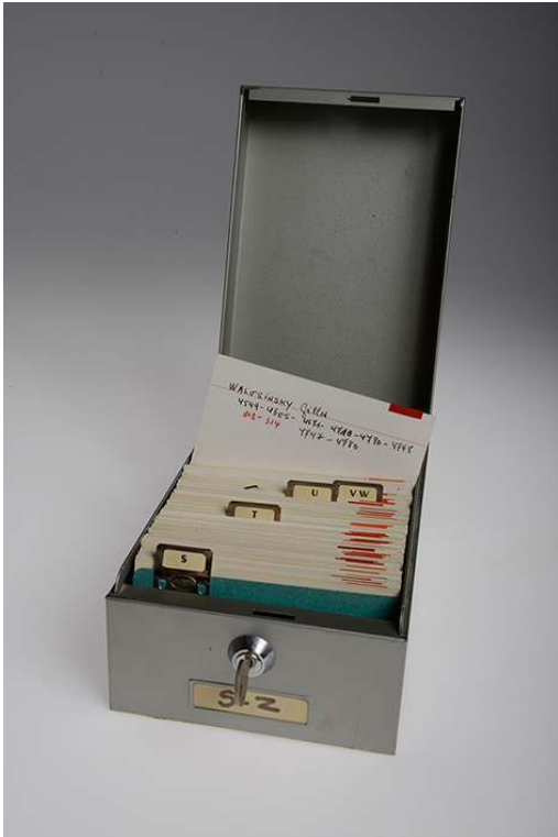
Fichier matière, fonds Jean Lattes (40 F1).