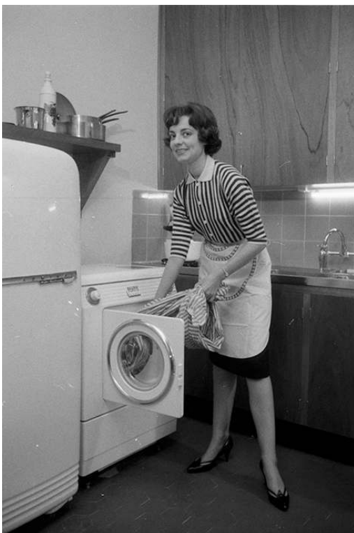
Bas Le Bourget, 1958.