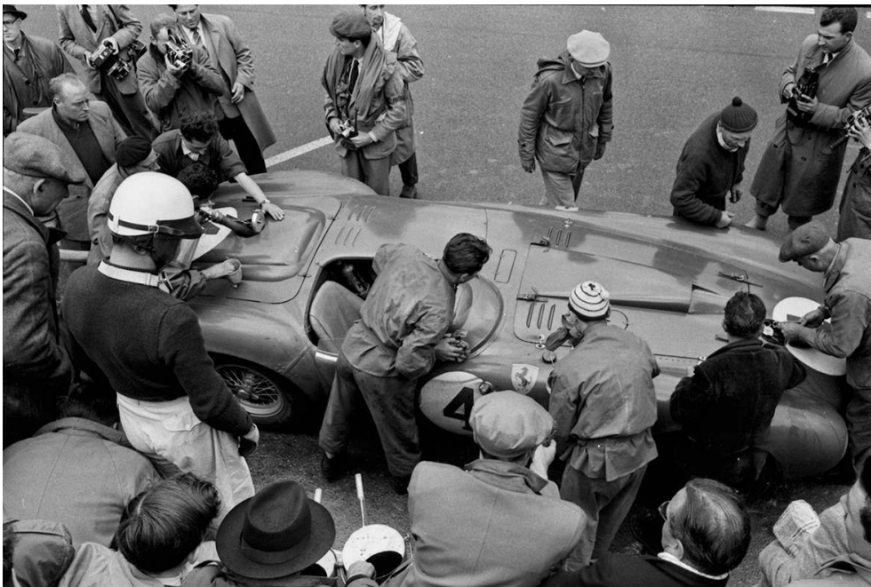
Les 24 heures du Mans, 1954.