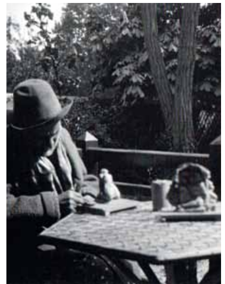
Le sculpteur Antoine Bourdelle au Vésinet.