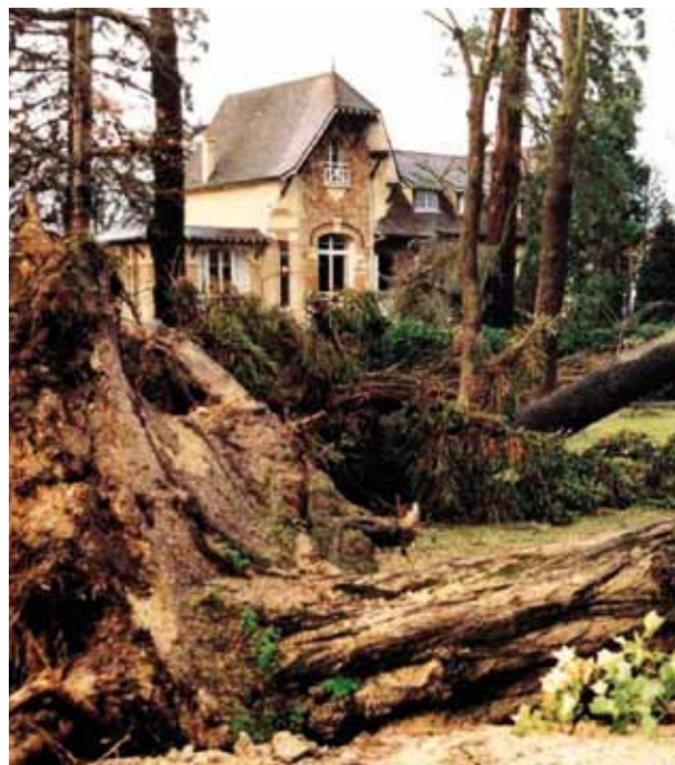
La tempête de 1999.