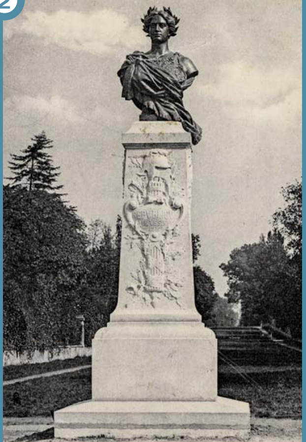
Davin, statuaire. LE VESINET. — Le Monument à LA REPUBLIQUE.