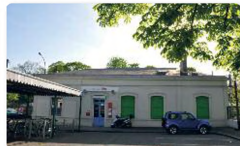
▲ Le bureau SNCF

La gare du Pecq va être légèrement déplacée en 1955 : un nouveau bâtiment voyageurs est construit rue Watteau à quelques dizaines de mètres de l'ancien qui n'est pas détruit et qui sera jusqu'en 2011 le bureau SNCF. Il est aujourd'hui désaffecté.