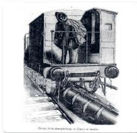
▲ Wagon directeur du chemin de fer atmosphérique de St Germain supprimé en 1859.

Un accident sans doute dû au système de freinage défectueux fit trois morts le 6 septembre 1858 et entraîna la fin de l'expérience du système « atmosphérique » en 1860.