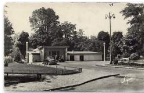
▼ La troisième Gare du Pecq, qui désormais abrite l'Harmonie municipale du Vésinet

La gare du Pecq va être légèrement déplacée en 1955 : un nouveau bâtiment voyageurs est construit rue Watteau à quelques dizaines de mètres de l'ancien qui n'est pas détruit et qui sera jusqu'en 2011 le bureau SNCF. Il est aujourd'hui désaffecté.