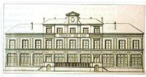
▲ Façade de la première Gare du Pecq, côté Seine, œuvre de l'architecte Alfred Armand

Une stèle, située avenue de la Paix au Pecq, matérialise le point d'arrivée de la voie.