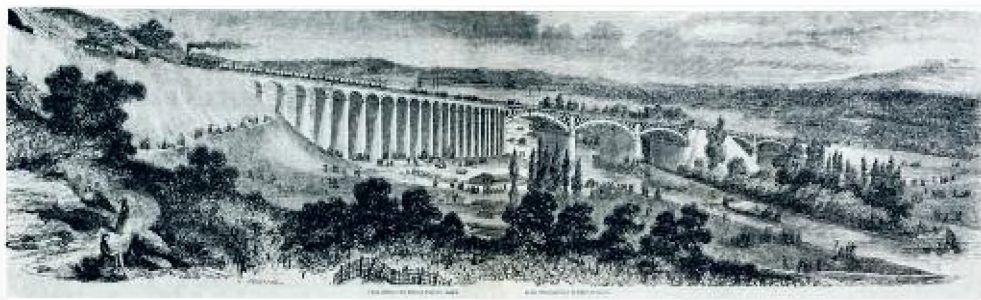
▲ Vue générale des travaux d'art du Chemin de Fer atmosphérique de St Germain