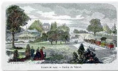
▲ La Station du Vésinet 1859

Une nouvelle gare, est bâtie en 1861. Elle prend le nom de « Gare du Pecq » tandis que celui de « Gare du Vésinet » désignait la gare du village (l'actuelle Vésinet-Centre).