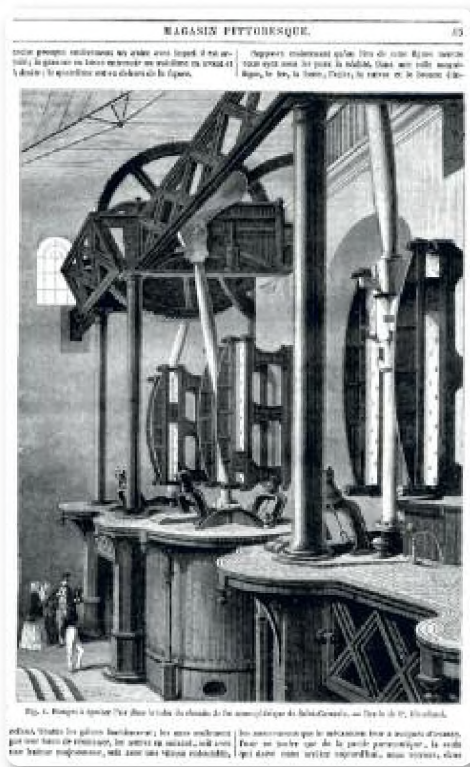
▲ Pompes à épuiser l'air dans le tube du chemin de fer atmosphérique de St Germain.

Pour la montée, un système ingénieux "aspirait" le train grâce à d'énormes pompes situées à Saint-Germain. Le train redescendait par gravité, ralenti par des freins.