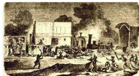
▼ Représentation de l'accident du 6 septembre 1858 en gare du Vésinet