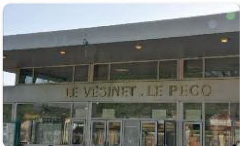
▲ La quatrième Gare du Vésinet-Le Pecq

En 1972, avec la mise en service du RER, une nouvelle gare est construite. C'est celle que nous connaissons aujourd'hui et qui trouve enfin son nom actuel « Le Vésinet - Le Pecq »