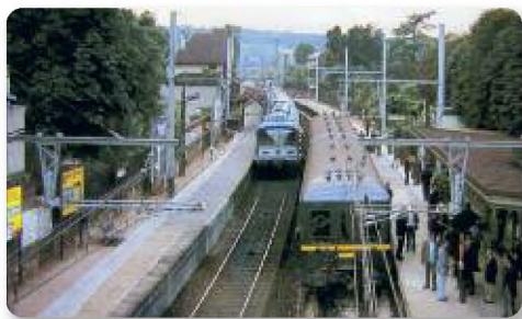
▲ Les derniers jours de la troisième gare : dernier train SNCF et premier RER (1 er octobre 1972)

En 1972, avec la mise en service du RER, une nouvelle gare est construite. C'est celle que nous connaissons aujourd'hui et qui trouve enfin son nom actuel « Le Vésinet - Le Pecq »