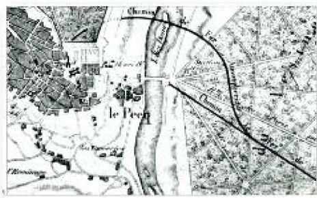
▲ Plan indiquant l'ancien tracé de la ligne avec terminus au Pont du Pecq, et le nouveau tracé du chemin de fer atmosphérique ouvert en 1847

En 1847, lors de la construction du chemin de fer atmosphérique, la nouvelle voie pour Saint-Germain s'embranchait avant le débarcadère qui se retrouve hors de la ligne. Une gare provisoire est édifiée dans le bois du Vésinet et devient la Station du Vésinet.